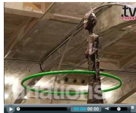
report / JOHN BALDESSARI, "THE GIACOMETTI VARIATIONS" – Fondazione Prada, Milano