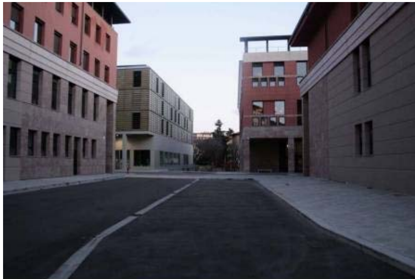
Adolfo Natalini - Polo universitario - Novoli, Firenze 2008

Andy Warhol affermava: "La cosa più bella di Firenze è McDonald's". Forse la stessa ironia servirebbe a confermare che l'evoluzione richiede passi nuovi e che il rischio è quello di confondere la contemporaneità con un'appropriazione del passato facile e di consumo.